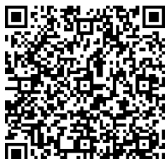
Pfadis Wr Neudorf, Mitglied werden

oder die Website der Pfadfinder und Pfadfinderinnen Wiener Neudorf. Gerne können Sie auch folgende QR-Codes nutzen: