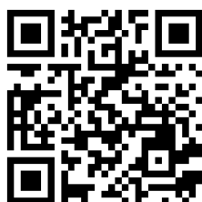
Pfadis Wr Neudorf, Mitglied werden

oder die Website der Pfadfinder und Pfadfinderinnen Wiener Neudorf. Gerne können Sie auch folgende QR-Codes nutzen: